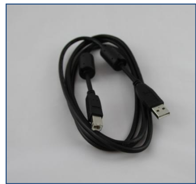
USB Kabel Drucker-PC