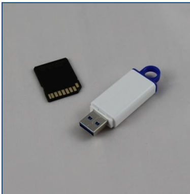
SD-Karte und USB-Stick